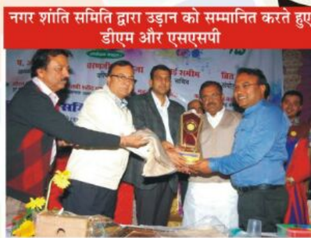
नगर शांति समिति द्वारा उड़ान को सम्मानित करते हुए डीएम और एसएसपी