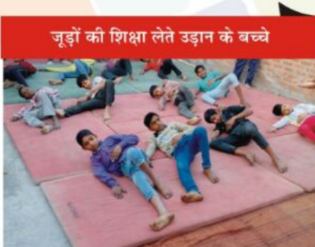
जूड़ों की शिक्षा लेते उड़ान के बच्चे