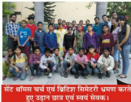
सेंट थॉमस चर्च एवं ब्रिटिश सिमेटरी भ्रमण करते हुए उड़ान छात्र एवं स्वयं सेवक।