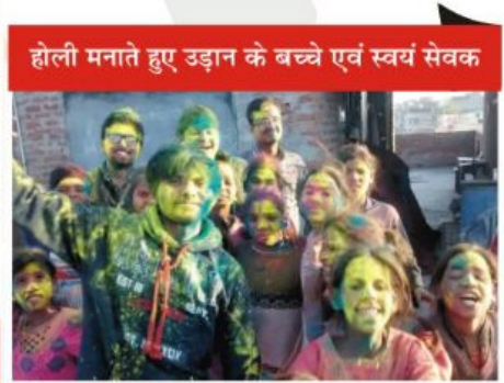
होली मनाते हुए उड़ान के बच्चे एवं स्वयं सेवक