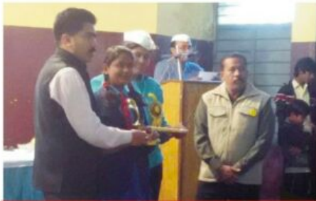
'पटाखे पर्यावरण के दुश्मन हैं' निबन्ध प्रतियोगिता का पुरस्कार वितरण।