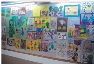
पर्यावरण जागरूकता अभियान के अंतर्गत आर्ट गैलरी में प्रदर्शनी।