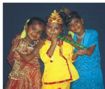
उड़ान में जन्माष्टमी पर्व।