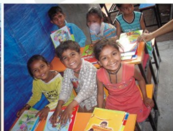
कबाड़ बिनने वाले बच्चे उड़ान में पढ़ते हुए।