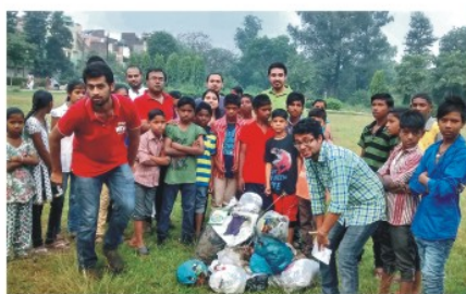
कंपनी गार्डन में क्रेज़ीग्रीन द्वारा सफाई अभियान।