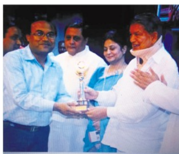
उत्तराखण्ड मुख्यमंत्री द्वारा क्रेज़ीग्रीन को सम्मानित।